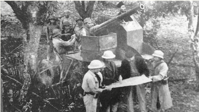
Một khẩu đội pháo của Vệ Quốc đoàn tại trận địa pháo đài Láng, tháng 12/1946.

Ban Thường vụ Thành ủy yêu cầu các cấp, ngành đẩy mạnh tuyên truyền sâu rộng về ý nghĩa