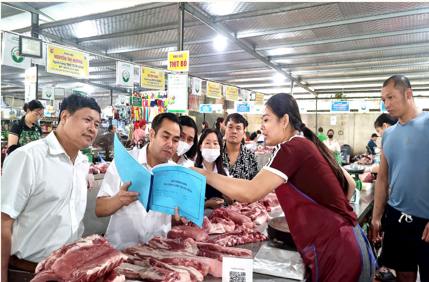
Ngày 06/5/2026, Đoàn kiểm tra số 2 - Sở Nông nghiệp và Môi trường kiểm tra đột xuất về nguồn gốc, xuất xứ tại quầy hàng bán thịt lợn, gà tại chợ Thượng Thanh (phường Việt Hưng).

Công an Thành phố tăng cường kiểm tra, kiểm soát việc lưu thông, vận chuyển động vật, sản phẩm động vật từ các tỉnh, thành phố khác vào Hà Nội; kịp thời phát hiện, ngăn chặn và xử lý nghiêm các hành vi buôn lậu, vận chuyển, kinh doanh, tiêu thụ động vật và sản phẩm động vật