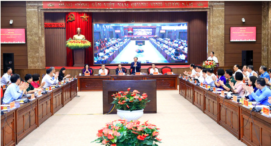
Thành phố Hà Nội tổ chức hội nghị triển khai, thi hành Luật Thủ đô số 02/2026/QH16.

Ban Thường vụ Thành ủy Hà Nội vừa ban hành Chỉ thị số 15-CT/TU ngày 04/5/2026 về tổ chức triển khai thi hành Luật Thủ đô, yêu cầu các cấp, các ngành triển khai đồng bộ, quyết liệt, hiệu quả, xác định đây là nhiệm vụ chính trị trọng tâm, có ý nghĩa đặc biệt quan trọng đối với sự phát triển của Thủ đô trong giai đoạn mới.