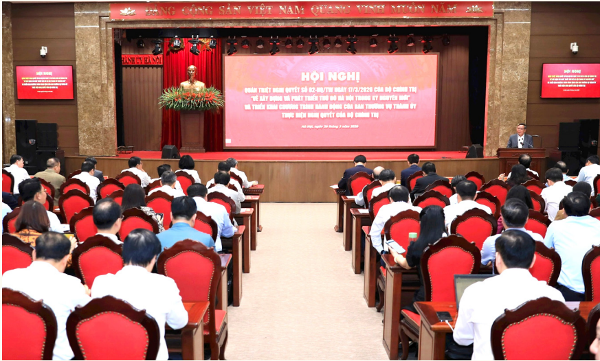
Thành ủy Hà Nội tổ chức hội nghị quán triệt Nghị quyết số 02-NQ/TW ngày 17/3/2026 của Bộ Chính trị.

hiện đại; hội tụ tinh hoa văn hóa, hội nhập quốc tế sâu rộng; có năng lực cạnh tranh cao; là Thành phố thanh bình, người dân hạnh phúc, điềm đến an toàn, thân thiện và hấp dẫn. Đồng thời, hình thành một số trung tâm giáo dục - đào tạo, y tế chất lượng cao thuộc nhóm dẫn đầu khu vực; trung tâm dịch vụ tài chính, thương mại, đổi mới sáng tạo quốc gia, khu vực và quốc tế; trung tâm nghiên cứu và phát triển, giữ vai trò hạt nhân liên kết phát triển vùng và cả nước.