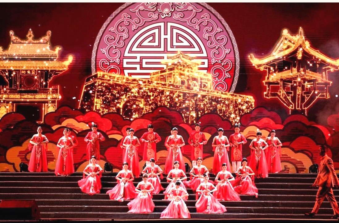
Festival Thăng Long - Hà Nội 2025

Ngoài ra, Thành phố yêu cầu định hướng xây dựng một chiến