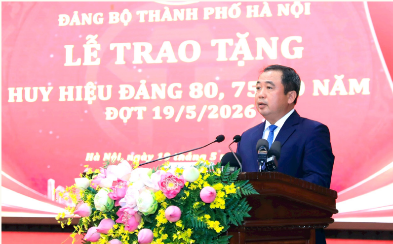
Ủy viên Bộ Chính trị, Bí thư Thành ủy Hà Nội Trần Đức Thắng phát biểu tại buổi lễ.

Đồng chí Trần Đức Thắng nhấn mạnh, Đảng bộ, chính quyền và Nhân dân Thủ đô luôn trân trọng, biết ơn sâu sắc đối với những cống hiến, hy sinh và đóng góp bền bỉ của các thế hệ đảng viên lão thành đối với sự nghiệp cách mạng của Đảng, của dân tộc và Thủ đô. Đồng thời khẳng định, Đảng bộ thành phố Hà Nội sẽ tiếp tục phát huy truyền thống đoàn kết, đổi mới, sáng tạo; khơi dậy mạnh mẽ ý chí và khát vọng phát triển; quyết tâm xây dựng Thủ đô ngày càng văn hiến, văn minh, hiện đại, hạnh phúc, xứng đáng